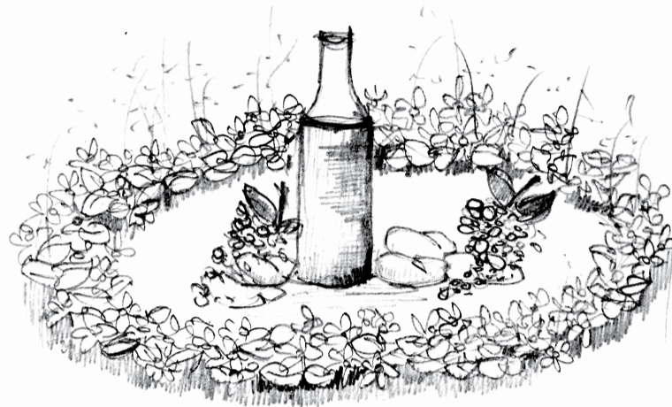
ILUSTRAÇÃO DA ARQ. MARIA TAVARES

CONCRETIZAÇÃO: Seguir Jesus é a atitude mais assertiva para contemplar a surpresa da abundância e da gratuidade de Deus. Ele surpreende-nos e, na abundância do pão que se pode partilhar, manifesta-se a abundância do amor que tudo cria para saciar as nossas fomes. Esta universalidade do amor salvífico de Deus pode ser representado num arranjo floral circular, contendo no centro água, pequenos pães e uvas, para evidenciar a centralidade da Eucaristia, como alimento fundamental para os cristãos.