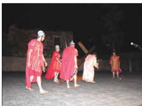
Noite UP'S Braga, 23-24 Maio